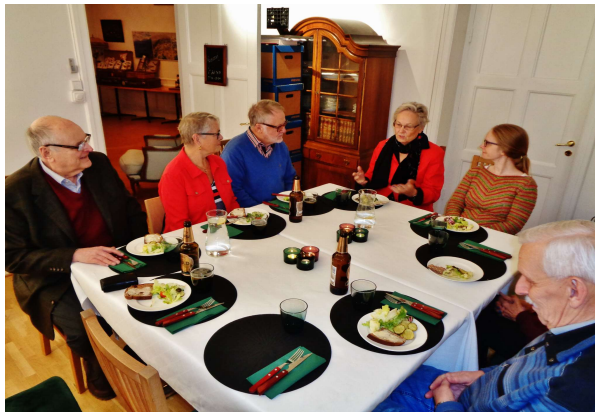
E-gruppen i december 2017.

E-gruppen består av medlemmar i G-gruppen som har sina rötter i Baltikum, främst Estland. Man träffas i Stockholm höst och vår, omkring 8 gånger då man hjälper varandra med forskning samt umgås i allmänhet. Gruppen som är experterna på Estland bistår släktforskare på Diskussionslistan.