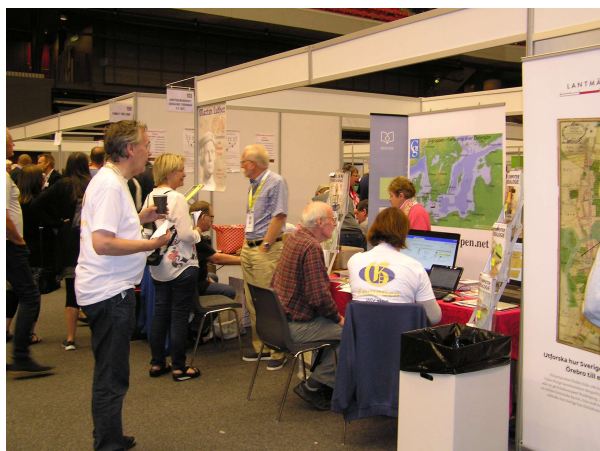
Montern i Halmstad där G-gruppen deltog.

G-gruppen deltog i Släktforskar dagarna 2017 i Halmstad tillsammans med nio tyska släktforskarföreningar i en gemensam monter. Dagarna var välbesökta med totalt 5375 närvarande. G-gruppen fick tillsammans med de tyska föreningarna besvara ett otal frågor om hur man släktforskar i Tyskland och även vad ett medlemskap i G-gruppen innebär.